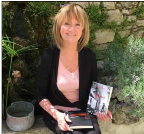
épilogueS est le dernier ouvrage d'une trilogie démarrée il y a 3 ans.

« Dans A l'ombre du soleil , le but était d'innocenter Véronique, accusée du meurtre d'un petit garçon, rappelle l'auteur. Dans... épilogueS , on retrouve donc son fils Alexandre, 20 ans après et nous sommes en 2016. » Ce dernier est alors gendarme à la section de recherche de Nice. Une loi vient de